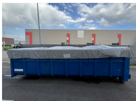
Benne multi ou ampliroll de 4 à 90m 3 Dimensions standard ou sur-mesure