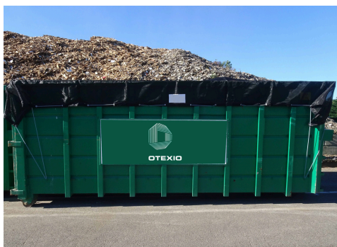
Benne multi ou ampliroll de 4 à 90m 3 Dimensions standard ou sur-mesure